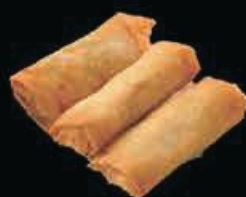
A2 Involtini (3pz) gamberi, verdure € 3.00