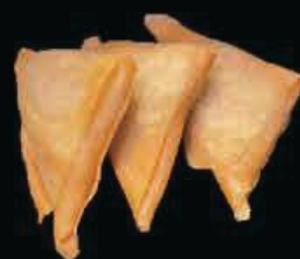
A3 Involtini curry (3pz) € 3.00