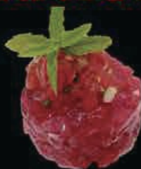
M10 Tartar maguro tartar di tonno con salsa special € 8.00