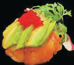
M12 Dragon tartar pallina di tartar salmone ricoperto di avocado, tobiko, mandorle pepite di tempura e teriyaki € 8.00