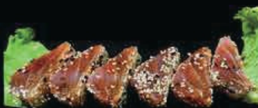
M18 Tataki maguro tonno scottato con sesamo e salsa anago € 12.00