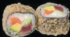
F4 Futo mex futomaki fritto con salmone, avocado, philadelphia e surimi con salsa teriyaki € 8.00