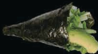
T10 Vege cetriolo, insalata e avocado € 3.50