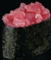
K2 Maguro base di riso con tartar di tonno spicy maio e tobiko € 5.00