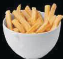
A13 Patate fritte patate fritte € 3.00