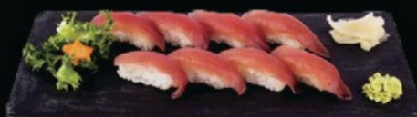
N23 Nigiri tonno 8pz € 11.00