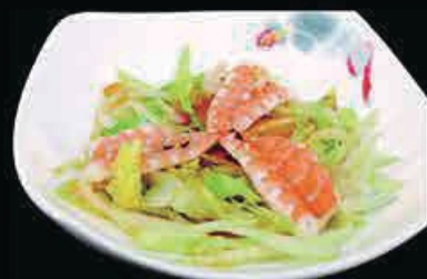
A23 Insalata ebi insalata con gamberi cotti, mais, salsa, pepite di tempura e crema di tonno € 6.00