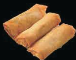
A1 Involtini vege (3pz) verdure miste € 2.50