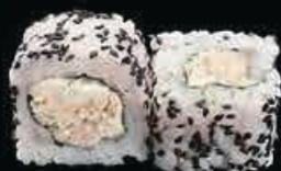
U10 Ura Miura salmone cotto con philadelphia, e salsa teriyaki € 8.00