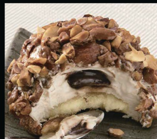
Croccante alle mandorle € 5.00