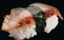
N6 Anago anguilla, teriyaki € 4.00