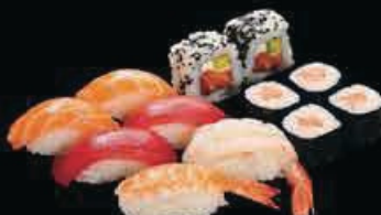
M5 Sushi mix1 (12pz) € 11.00