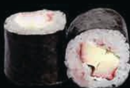
H5 Kani maki surimi € 4.00