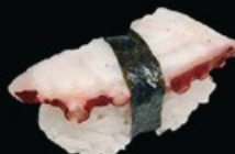
N7 Tako polpo, teriyaki € 3.00