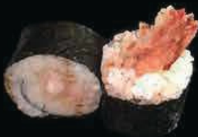
F2 Futo ebiten gamberi in tempura con avocado, maionese, teriyaki € 6.00