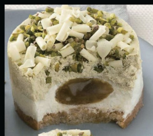
Cre moso al pistacchio € 5.00