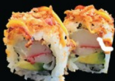
U20 Ura Crok surimi, maionese, avocado, cipolla fritto esterno con la salsa teriyaki e spicy-maio € 9.00