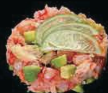
M11 Mix tartar misto di pesce con avocado e salsa special € 8.00