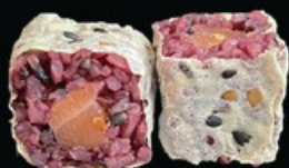
H12 Black hosu sake 8pz salmone € 4.50