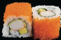
U14 Ura Tobiko surimi con maionese, avocado e uova di pesce volante € 10.00