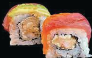
X4 Special ebiten gambero in tempura, Philadelphia filetti di pesce misto avocado e teriyaki € 11.00