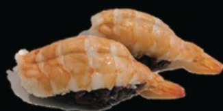
N20 Black ebi 2pz gambero cotto € 4.00