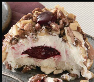
Croccante all'amarena € 5.00