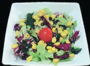
A21 Insalata insalata, mais con salsa € 5.00