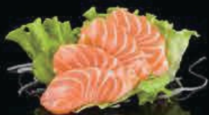
M1 Sashimi di salmone (6pz) € 6.00