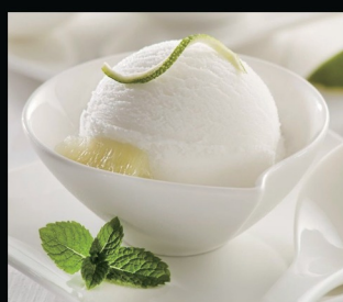
Pallina di gelato fior di latte limone € 1.50