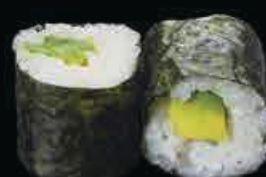
H6 Abo maki avocado € 3.50