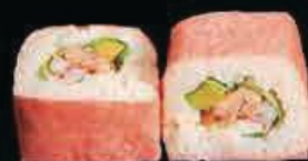
F6 Futo pink salmone cotto, insalata, philadelphia gambero cotto e spicy maionese € 7.00