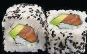
U2 Ura Sake avocado e salmone € 8.00