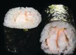
H3 Ebi maki gambero cotto € 4.00