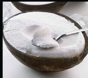
Cocco ripieno € 5.00