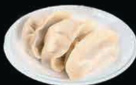
A5 Ravioli (3pz) carne di maiale, verdure, zenzero e erba cipollina € 4.00