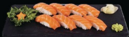
N22 Nigiri sake 8pz € 10.00