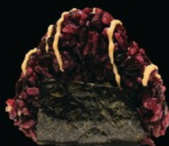
O4 Spicy salmon 1pz riso venere con salmone crudo piccante con tobiko, spicy maio € 3.00