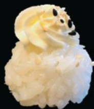
K7 BIGNÈ PHILA bocconcino di riso con phila e kadaifi € 3.50