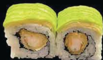
X7 Drago Roll gambero fritto con avocado esterno e salsa teriyaki € 10.00