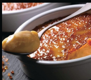
Crema catalana in coccio € 6.00