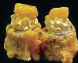
H9 Hosomango sake maki in tempura salmone, philadelphia, mango e salsa mango € 8.00