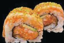
X6 Salmone out tartar di salmone, avocado filetti di salmone scottato teriyaki e polvere di pistacchio € 12.00