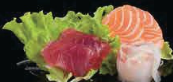
M2 Sashimi mix (6pz) € 7.00