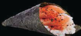
T6 Spicy sake salmone piccante, maionese, tobiko e avocado € 4.00