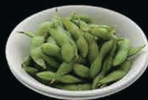
A9 Edamame fagioli di soia € 4.00