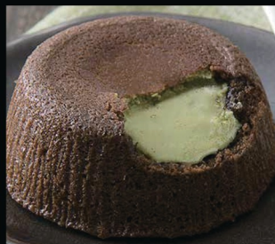
Soufflé al pistacchio € 5.00