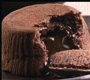
Soufflé al cioccolato € 5.00