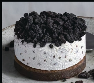
Black biscuit € 5.00