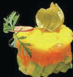
M14 Tartar special mango tartar di salmone, avocado, mango e salsa mango € 9.00