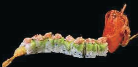
X2 King Dragon gambero in tempura, avocado tartar d'astice, maionese tobiko e teriyaki € 14.00