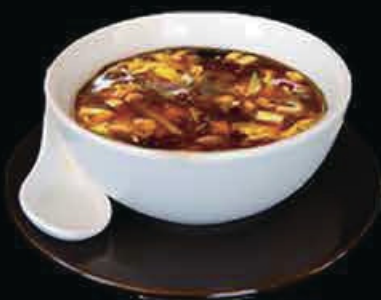
A19 Zuppa agro-piccante bambù, tofu, piselli funghi, carote, uova € 4.50