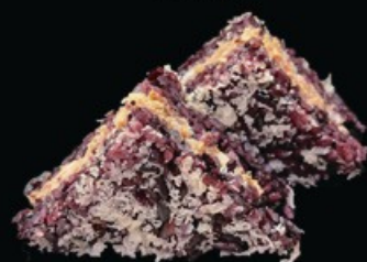
O5 Tramezzino California 2pz riso venere, crema di tonno gambero cotto, sesamo, maionese pepite di tempura e salsa teriyaki € 5.00