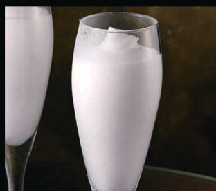
sorbetto al limone / liquirizia € 3.00