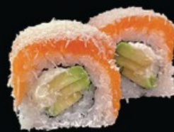
U24 Ura cocco avocado, Philadelphia cetrioli, filetti di salmone e cocco € 10.00