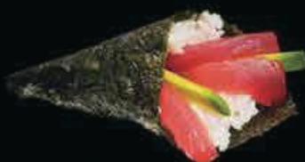
T2 Maguro tonno e avocado € 4.00