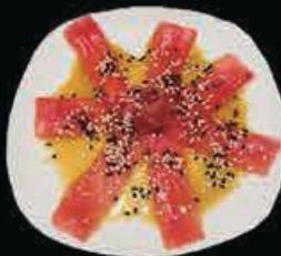
M16 Carpaccio Maguro tonno con salsa speciale € 9.00