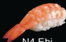
N4 Ebi gambero cotto € 3.00