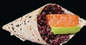
T5 Te Black Sake 1pz riso venere, avocado, salmone € 4.00