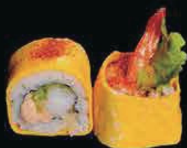
X1 Ura King crema di tonno, maionese gamberi in tempura, insalata e frittata all'esterno con la salsa teriyaki € 11.00