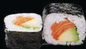
F3 Kirei salmone, surimi e avocado € 5.00