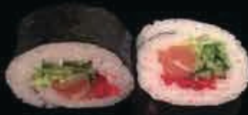
F5 Futo misto cetriolo, salmone insalata e tobiko € 6.00