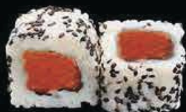
U4 Ura Spicy sake tartar di salmone, avocado spicy maio, tobiko € 8.00