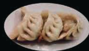
A6 Ravioli alla piastra (3pz) carne di maiale, verdure, zenzero e erba cipollina € 4.00