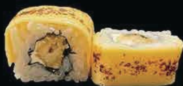
U7 Ura Cheesebitten gamberi in tempura, sottilette flambate e salsa teriyaki € 10.00