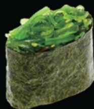
K5 Wakame base di riso con gome wakame € 4.00