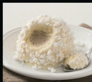
Tartufo bianco € 5.00