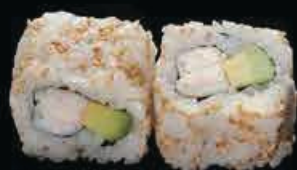
U1 Ura Sumo surimi, avocado e gambero cotto € 8.00