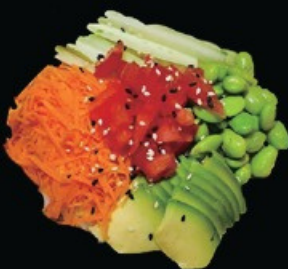
C5 Vegan poke sesamo, avocado, edamame cetriolo, carote e pomodoro sul letto di riso bianco € 9.00