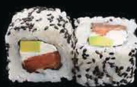
U3 Ura Phila avocado, philadelphia e salmone € 8.00