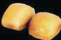
A15 Mantou fritto € 4.00 / 2pz