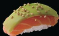
N10 Sake abo salmone avocado sesamo € 3.50