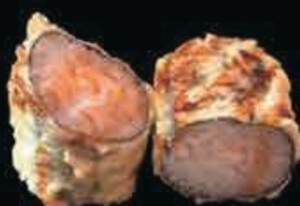
H8 Shibuya sakemaki in tempura con spicy maio € 6.00