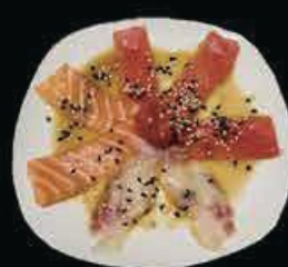
M17 Carpaccio Mix salmone, tonno, branzino con salsa speciale € 9.00