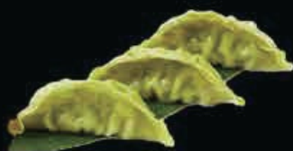
A7 Ravioli vegetariani (3pz) ravioli verdi con verdure al vapore € 3.50