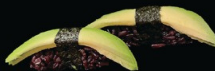
N21 Black abokado 2pz avocado € 3.50