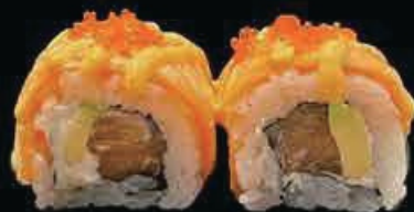
X9 Vulcano Roll salmone, avocado, philadelphia, esterno salmone scottato con spicy maio e tobiko € 12.00