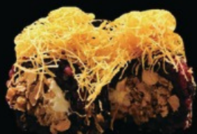
U30 Black miura 8pz riso venere, salmone cotto philadelphia con salsa teriyaki e kadaif all'esterno € 9.00