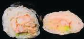
F1 Futo califonia gamberi cotti, avocado tonno e maionese € 5.50