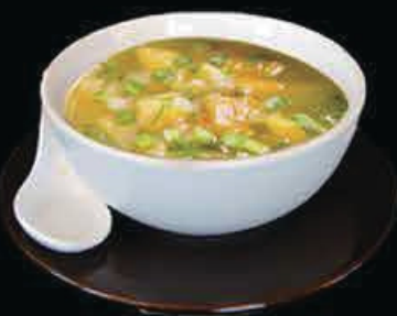
A18 Zuppa pollo uova, pollo e mais € 4.00