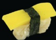
N11 Oshinko rapa € 2.50