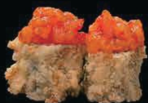
H10 Shibuya spicy hosomango sake fritto, tartar di salmone piccante maionese, tobiko e teriyaki € 8.00