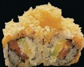
U23 Ura Special phila avocado, philadelphia pepite di tempura salmone e salsa teriyaki € 9.00