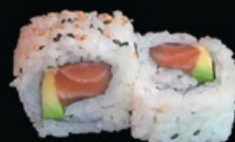
U18 Ura salmone cali crema di tonno, maionese salmone, avocado € 9.00