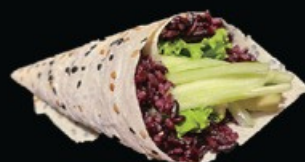
T8 Te black vege 1pz riso venere, insalata, cetrioli e avocado € 4.00