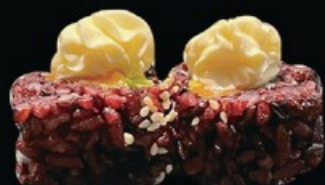
U33 Black phila 8pz riso venere, salmone avocado e philadelphia € 9.00