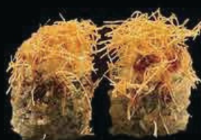
H11 Shibuya phila hosomango sake fritto Philadelphia, teriyaki e chips € 8.00