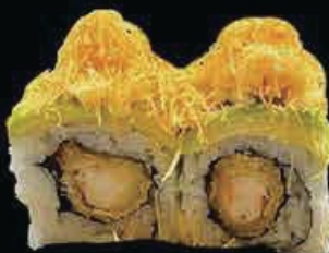
X8 Drago Special roll gambero fritto con avocado, tartar di gambero cotto con tobiko leggermente piccante, maionese, chips e teriyaki € 12.00