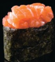
K1 Sake base di riso con tartar di salmone spicy maio e tobiko € 4.50