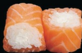
U26 Salmon Roll (6pz) salmone esterno, riso, philadelphia e salsa teriyaki € 7.00