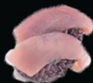
N18 Black maguro 2pz tonno € 4.50