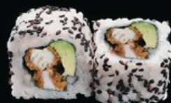
U15 Ura Chirin pollo fritto con insalata maionese e salsa teriyaki € 8.00