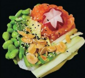
C4 Salmon poke sesamo, avocado, edamame tartar di salmone, gome wakame, cetriolo mandorle e teriyaki sul letto di riso bianco € 10.00