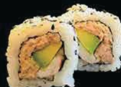
U9 Ura California crema di tonno, maionese gamberi cotti e avocado € 8.00