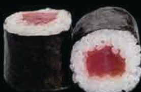
H2 Tekka maki tonno € 4.50