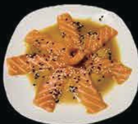
M15 Carpaccio Sake salmone con salsa speciale € 7.00