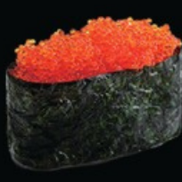
K3 Tobiko base di riso con uova di pesce volante € 5.00