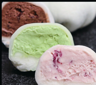
Mochi 3pz mango, pistacchio, tè verde fior di latte, cocco, fragola, cioccolato € 5.00