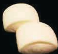
A14 Mantou € 4.00 / 2pz