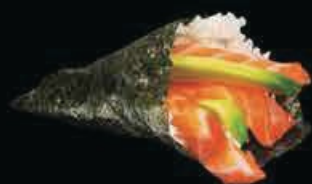
T1 Sake salmone e avocado € 3.50