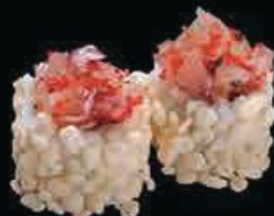
X5 Ura Soffi gambero fritto in tempura, tartar di branzino, philadelphia avocado, olio di tartufo, il tutto avvolto in riso soffiato con tobiko, salsa teriyaki e spicy maio € 11.00