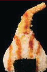
O3 Ebiten gamberi in tempura pepite di tempura e teriyaki € 3.00