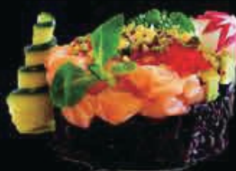
M13 Tartar club tartar di salmone e riso venere, tobiko scaglie di pistacchio e salsa teriyaki € 9.00