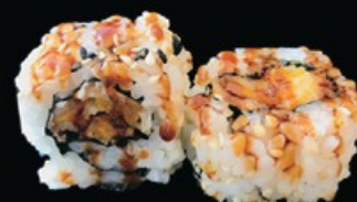
U21 Ura Vegiten zucca in tempura, philadelphia e salsa teriyaki € 10.00