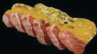
M4 Sashimi flambé salmone scottato ricoperto di salsa mango e decorato con granella di pistacchio € 10.00