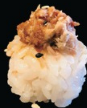
K8 BIGNÈ MIURA bocconcino di riso con salmone cotto, maionese, teriyaki € 3.50