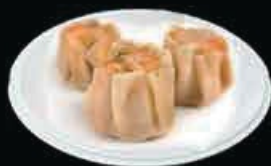
A4 Shaomai (3pz) gamberi, zenzero, erba cipollina carne di maiale, carote, piselli € 4.50