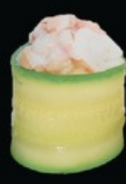
K4 Zucchine base di riso avvolti con zucchine, guarniti con tartar di gamberi spicy maio, tobiko € 5.00