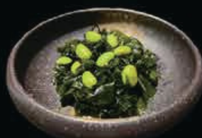
A8 Wakame edamame alghe con bacetti di soia con salsa € 4.50