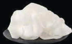
A16 Nuvole di drago nuvole di drago € 3.00