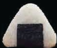
O1 Sake cotto salmone cotto, sesamo € 3.00