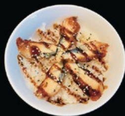
C3 Chirashi Anago ciotola di riso con anguilla e salsa teriyaki € 14.00