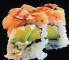
X3 Ura Rock tartar di salmone, philadelphia avocado, mandorle e salsa teriyaki € 10.00