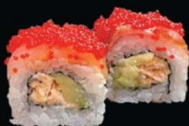
U25 Fenice roll salmone in tempura, philadelphia avocado, filetti di branzino tobiko e teriyaki € 11.00