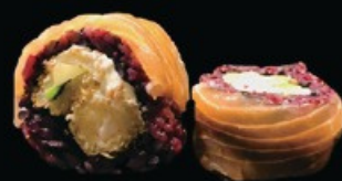
U29 Black salmone 8pz riso venere, salmone fritto zucchine fritte, philadelphia, guarniti con salmone e salsa teriyaki € 11.00