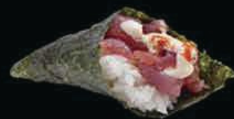
T7 Spicy tuna tonno piccante, maionese, tobiko, avocado € 4.50