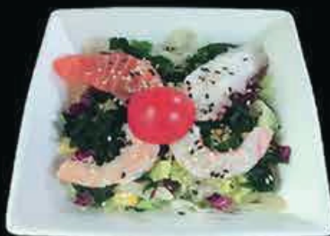
A22 Insalata sakana insalata, mais, pesce misto crudo con salsa € 6.00