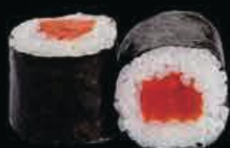
H1 Sake maki salmone € 4.00