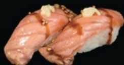
N13 Sake flambé salmone scottato con sesamo e spicy maio e teriyaki € 3.50