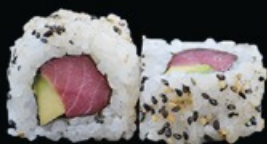
U19 Ura Maguro tonno crudo, avocado € 9.00