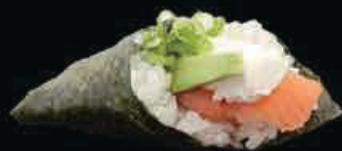
T4 Phila salmone con philadelphia e avocado € 3.50