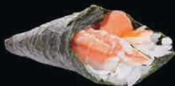
T9 California crema di tonno con maionese salmone e gambero cotto € 4.00