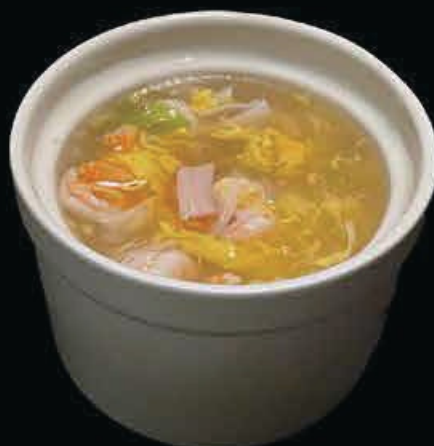
A24 Zuppa ai frutti di mare gamberi, surimi, uova e erba cipollina € 4.50