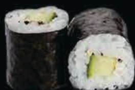
H4 Kappa maki cetriolo € 3.50