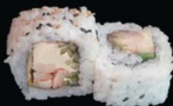
U17 Ura ebi phila avocado, philadelphia e gamberi cotti € 8.00