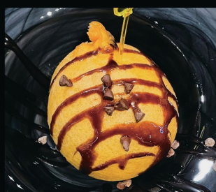
Gelato Fritto € 4.00