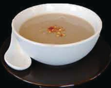
A17 Miso soup zuppa di miso con tofu, alghe ed erba cipollina € 4.00