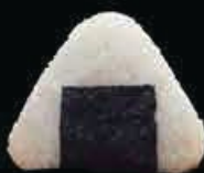
O2 Ebi gambero cotto € 3.00