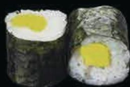
H7 Rapa maki rapa € 3.50