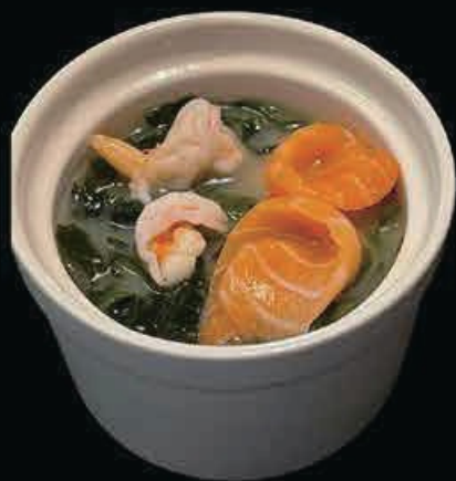
A20 Zuppa di pesce zuppa di pesce misto con miso, alghe € 5.00