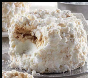
Meringa € 5.00