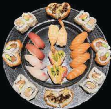
M7 Love mix (28pz) 10 nigiri, 8 uramaki 8 ura love, 2 futo pink € 30.00