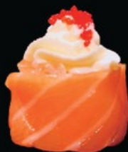
K6 Phila base di riso con philadelphia avvolto con salmone crudo e tobiko € 4.50