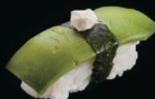
N8 Avocado avocado € 3.00