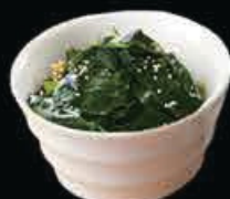
A11 Wakame alghe con salsa € 3.50