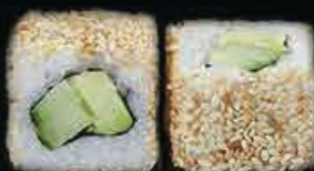
U8 Ura Vege avocado, cetriolo, insalata e philadelphia € 7.00