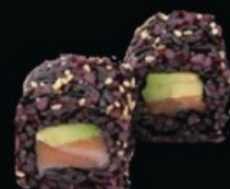
U32 Black sake 8pz riso venere, salmone e avocado € 9.00