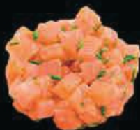
M9 Tartar sake tartar di salmone con salsa special € 7.00