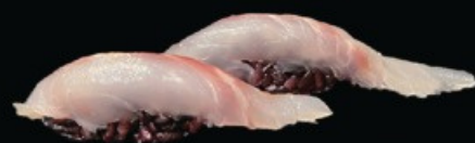
N19 Black suzuki 2pz branzino € 4.00