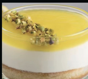
Coppa al limone di sorrendo ipp € 5.00