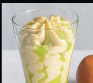
Coppa isabel € 5.00