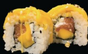
U22 Ura mango salmone, mango, philadelphia esterno mango e salsa mango € 10.00