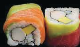
U6 Ura Arcobaleno surimi, avocado, maionese e filetti di pesce misto € 9.00