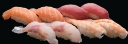
N24 Nigiri misto 10pz € 13.00