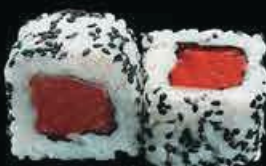
U5 Ura Spicy tuna tartar di tonno, avocado spicy maio, tobiko € 9.00