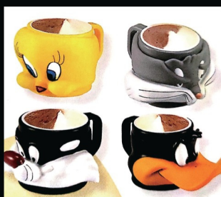
Tazza warner bros € 5.00