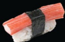
N9 Surimi surimi € 3.00