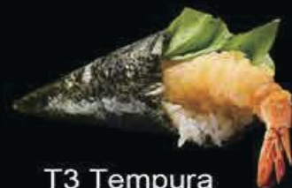
T3 Tempura gambero in tempura, maionese insalata, chips e salsa teriyaki € 3.50