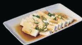
A12 Tofu tofu crudo, salsa di soia € 4.00