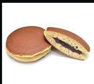
Dorayaki al gusto tè verde / cioccolato € 4.00