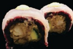
U28 Black branzino 8pz riso venere, salmone fritto zucchine fritte, philadelphia guarniti con branzino e salsa guacamole € 11.00