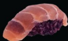
N17 Black sake 2pz salmone € 4.00