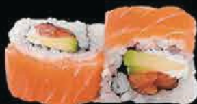
U11 Ura Kunsei salmone in tempura con philadelphia, salmone affumicato e avocado € 11.00