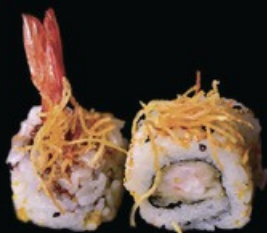
U13 Ura Ebiten gamberi in tempura con maionese, insalata, kadaif e salsa teriyaki € 9.00