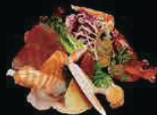
M3 Sashimi misto king 2 salmone, 2 tonno, 2 branzino, 1 scampi 1 gambero rosso e 1 vongola artica € 13.00 (1 porzione a persona)