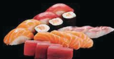
M6 Sushi sashimi mix2 (20pz) € 18.00