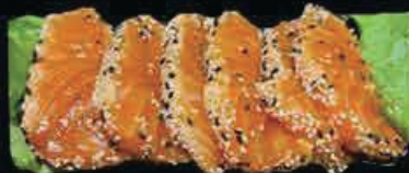
M19 Tataki salmone salmone scottato con sesamo e salsa anago € 10.00