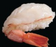
N5 Amaebi gambero crudo € 4.00