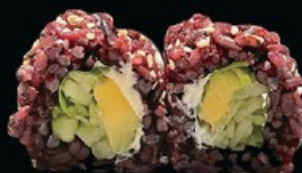
U31 Black vegan 8pz riso venere, avocado insalata, cetrioli e philadelphia € 8.00