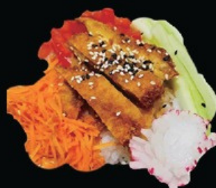
C6 Chicken poke Sesamo, cetriolo, pomodoro carote, pollo fritto e teriyaki sul letto di riso bianco € 10.00