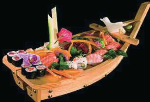
M8 Barca (38pz) 9 nigiri, 5 futomaki 8 hosomaki, 8 uramaki 6 sashimi, 2 gunkan € 38.00