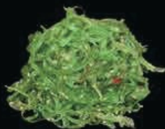
A10 Gome wakame alghe agro-piccante € 4.00