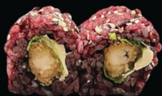
U27 Black ebiten 8pz riso venere, gamberi in tempura philadelphia, salsa teriyaki pepite di tempura € 10.00